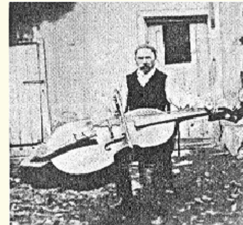
Bäuerischer Musikant mit „Ploschperment“ (Bassgeige). Iglau, um 1934.