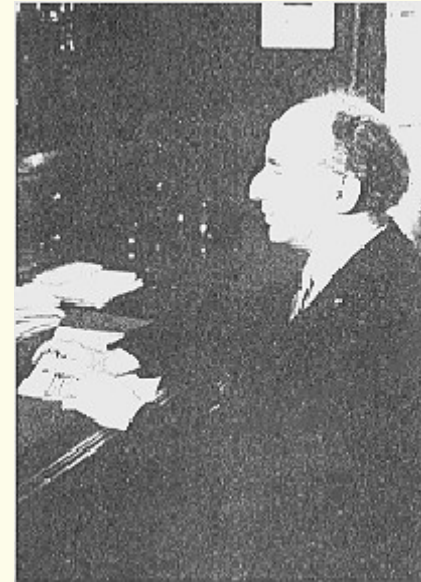
Oskar Baum, Kritiker, Schriftsteller, Orgel- u. Klavierpädagoge.