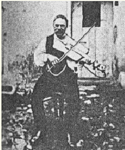
Bäuerischer Musikant mit selbstgefertigter Fiedel. In der Bauernmusik war das Spiel auf selbstgebauten Instrumenten üblich. Beliebte waren Quartett-Ensembles, hier - in der Gegend von Iglau - aus „Klorfiedel“, 2. „Klorfiedel“, „Grob-“